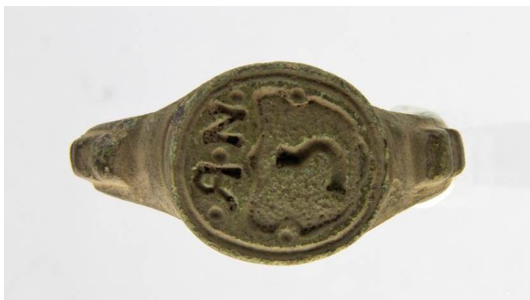
Signetring med initialerne "N. R." og et våbenskjold med et segl-lignende symbol

Et stykke derfra fandt jeg, efter at vinterens detektorfjendtlige isdække var smeltet, yderligere en dragtnål, denne gang fra jernalderen samt 2 såkaldte borgerkrigsmønter fra 1300-tallet. Dertil kommer en signetring med initialerne "N. R." og et flot våbenskjold som gode kræfter arbejder på at identificere. Signetringen vil jeg gætte på er fra 1800-tallet. Sjovt nok er bogstavet "N" på ringen ikke spejlvendt, måske har gravøren sovet i timen, måske er det i virkeligheden et gammelt "H"? Jeg donerer en flaske god rom af mærket "Matusalem" til den der kan identificere den oprindelige ejer af ringen!