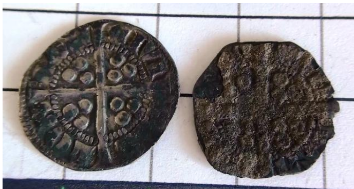
2 stk. Longcross Sterling, Edward II, England

Herudover har jeg sammen med detektorkollegerne fundet i alt 7 hulpenninge, dvs. små tyske sølvmønter, som endnu ikke er bestemt af museet, men som formentlig er lidt nyere end de engelske mønter. Dertil kommer i alt 7 borgerkrigsmønter, dvs. danske kobbermønter med et minimalt sølvindhold fra samme urolige periode af danmarkshistorien.