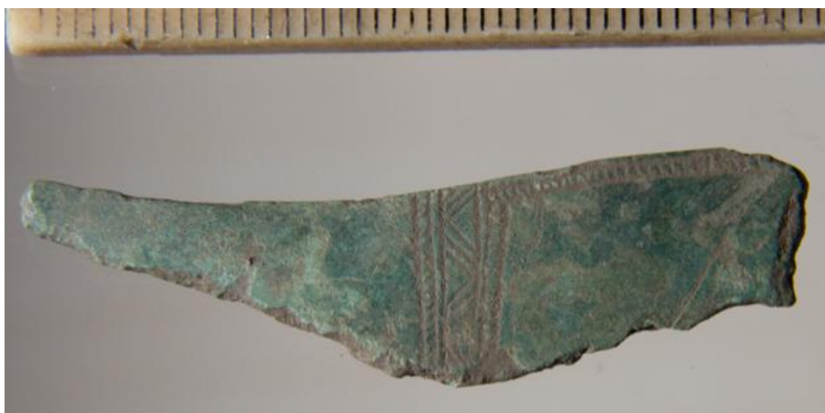
Ornamenteret fragment af ragekniv fra bronzealderen

En foreløbig krølle på Hemstok-søgningen blev fundet af et fragment af en ragekniv fra bronzealderen, som jo ligger ca. 2.800 år tilbage i tiden. Det fremgår af Nationalmuseets funddatabase "Fund og Fortidsminder", at der tidligere er gjort fund fra bronzealderen i området, men de tidligere fund er sket i forbindelse med overpløjning af gravhøje sidst i 1800-tallet, så det er ikke hver dag der dukker så fine ting op i Hemstok.