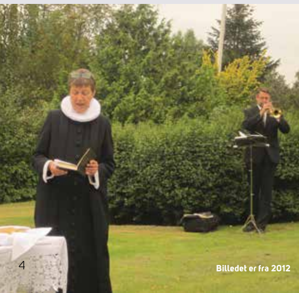
Billedet er fra 2012