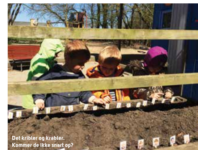
Det kribler og krabler. Kommer de ikke snart op?

Men Børnehavens stigende børnetal fortæller jo også, at vores små lokalsamfund spirer og gror – de unge småbørnsfamilier vælger at bosætte sig i det lokale. De vælger at være der, hvor man kommer sine naboer og hinanden ved. Uden det gode liv for hele familien ville det være en umulig opgave at lokke børn til Veng Skole og Børnehus, så det er i høj grad på grund af det gode sociale miljø i landsbyerne – at der bliver sået og gødet her, at vi kan være med til at høste frugterne. Så tak for jeres bidrag: at I åbner armene og byder ind.